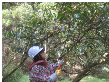
高枝鋏でゆずの収穫

・市郊外の山間部の有機栽培の整備されたゆず畑で、革の手袋・ヘルメットを着用して鋏でひとつひとつゆずを切り取っていきました。高いところは脚立に乗り、または高枝鋏を使って取りました。葉がついているときは2枚を残して取ります。ゆずはするどいとげがあるので注意が必要です。また、きれいな実は生食用にもなるのでなるべく丁寧に収穫しました。ゆずは柑橘類ではひとつとげがあるとのこと。とげがあることで収穫が難しいと聞きました。脚立に乗るのものはじめは怖かったのですが、慣れてくると上から見るゆずの木は気持ちよく、上手にとれた時は達成感がありました。ヘルメットにあたるとげの感触、優れた革製の手袋、収穫しやすいように手入れされた木。生産者の方がたとも楽しく交流できました。期待以上に充実した時間でした。萩は歴史を感じる良い町でした。日本果実工業の工場も見学させていただきました。自分でももっと利用したいし、知り合いにももっと利用を勧めたいと思います。（埼玉、60代女性）