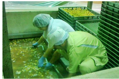
スクワット姿勢で塩漬けの梅を上げる

・塩漬けした梅干しを天日干しするためにコンテナにあげる作業と天日干ししていた梅干しをひっくり返す作業をしました。梅干しをつくる工程自体知らなかったのが勉強になりました。センターの方々が梅干し作りを最初の段階から行っていたり、センターに運ばれてきた柿を自分たちで積み替えたりして農家さんたちが農業に専念できる流れができていた事を知りました。