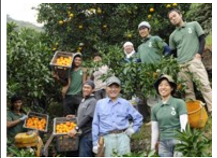
国際交流もできます

(西日本ファーマーズ 工カ四国;愛媛県) ◆2017年9月~2018年3月の間で最低7日以上 作業内容;野菜の植え付け、柑橘の収穫・管理、加工品の製造作業 滞在費用;無料(自炊)